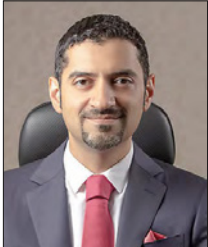
وزير شؤون الكهرباء

أكد م. وائل بن ناصر المبارك وزير شؤون الكهرباء والماء أن البحرين فقدت قائداً عظيماً، إذ كان رجل صاحب السمو الملكي الأمير خليفة بن سلمان آل خليفة، رحمه الله، فاجعة اليمّة لوطن والأمة العربية والإسلامية، وقال إن التاريخ سظل حافظاً لاسم سموه، وستظل الناصرة الوطنية مستذكّرة لجميع الإنجازات التي قادها سموه رحمه الله تعالى. وقال وزير الكهرباء والماء إن اهتمام سموه بالمواطن والمقيم كبير جداً، إذ كان يوجه على الدوام إلى ضرورة تسخير جميع إمكانيات الحكومة لتوفير الحياة الكريمة وتوفير كل المتطلبات المعيشية للمواطنين والمقيمين على هذه الأرض الكريمة. وأضاف أن صاحب السمو الملكي الأمير خليفة بن سلمان آل خليفة رحمه الله قد أدرك ركائز التنمية الشاملة في وقت مبكر، وأثر ذلك في تطور منظومة القوانين والتشريعات، ما أدى إلى تطور البحرين صحياً وتعليمياً واقتصادياً واجتماعياً وسياسياً وإنسانياً وغيرها. وكان لصاحب السمو الملكي رحمه الله إسهامات واضحة في المشروعات التنموية والبنى التحتية، وعلى الأخص مشروعات هيئة الكهرباء والماء، وكان الداعم الكبير لها لدفع عجلة التنمية. وكان حضور سموه في الميادين على أرض الواقع ليشهد عمليات الإنشاء والتطوير في مختلف المحافظات، وليستمع إلى ملاحظات جميع المواطنين والمقيمين لتطوير هذه المشاريع. وختاماً، أكد وزير شؤون الكهرباء والماء أن سموه كان رجل التنمية والميادين وصاحب الإنجازات الكبيرة، فلا يمكن نسيان إنجازات سموه العظيمة.