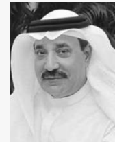
بقلم: جميل حميدان

ورحل عن دنيانا أبو الإنسانية.. رحل باني نهضة البحرين الحديثة، ووالد البحرينيين جميعاً، وكل من يعيش على هذا الوطن المعطاء، وهذه الأرض الطيبة. خليفة بن سلمان، أبو علي، فارس رجل عن جواده، وفائد إن غادر المكان فلا يمكن أن تغادره سفينته البناء والتنمية بهذا السبل الناصع من العطاء والإنجاز الزاخر بمواقف ومحطات ملؤها الحمرة لأبناء البحرين، والإنحساس الأبوي العميق بتوفير كل ما يخص مصالحهم وعيشهم الكريم واللائق. صاحب السمو الملكي الأمير خليفة بن سلمان آل خليفة -رحمه الله- فقيد البحرين الغالي، المغفور له بإذن الله تعالى، لم يكن ينطق سوى المواطن البحريني، صحته، تعليمه، توظيفه، سكنه، معيشته، تنمته.. ولم يخل أي اجتماع من قرارات تهدف إلى صون حقوق هذا المواطن وتكفل له المعيشة الكريمة في كافة مناحي الحياة. فدانما وأبداً كان المواطن في وجدان سموه، يدافع عن مصالحه وحقوقه، وكنسبته، ويبادر إلى معالجة التحديات وتجاوز المعوقات التي تقف أمام احتياجاته، ويظل سموه