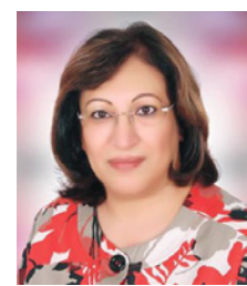
فاة بنت سعيد الصالح

الأمير خليفة مخططاً وموجهاً لحركة التنمية الشاملة في بلادنا يمكن لنا ملاحظة مقدار ما استفاد منه المواطن البحريني من مكاسب تنموية لتكوين حياة مدنية منفتحة على العمل والنمو والحداثة، فري كثيرة منعتلة تحولت إلى مدن تتوافر فيها أحدث الطرق وسبل العيش، وتنشط فيها حركة التعليم والأسواق، أحياء صغيرة تحولت إلى ضواحي كبيرة، مساحات شاسعة تحولت إلى عمران بشري كثيف، تجملها مساكن حديثة وتقريبها مواصلات معتدة، انتشار واسع للتعليم وقضاء على الأمية، وكوادر ذكية في الإدارة والتكنولوجيا والتكنولوجيا، وافتتاح على الإعلام وتكنولوجيا المعلومات، وتميز يثير الإعجاب والهدشة بتراث البحرين العريق ولما تميزت به من مسجلة عالمياً وثقافتها وفنونها التشكيلية وإنجازها الحضري الذي جرى على مدى سنين بخطوات تستوعب حدود الجغرافيا وتتوسع فيها توازن مدهوس. إنها تنمية شاملة تصوغ للعالم نموذجاً منفرداً بالفعل، وهو ما انعكس بشكل واضح في تكريم مملكة البحرين في المؤتمرات العالمية، وتكريم شخصية الأمير خليفة بالعديد من الجوائز الدولية والأوسمة والقلادات التكريمية التي تعرفت بها قديمه من تحقيقات تنموية في مجال التنمية الحضرية. ولقد بينت بعض أسباب نموذجيتها، لكن لا بد من الإشارة أخيراً إلى العبد الإنساني لهذا النموذج من التنمية الذي وضعه سمو الأمير خليفة، فهداه التنمية في نهاية المطاف كانت مصدر حماية لحياة المواطن البحريني، إنها أحد أهم أسباب الاستقرار الاجتماعي، ولولا روح الحماية بروح احتواء الحاجات الإنسانية لما وقفت البحرين قوية