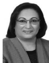
بقلم: فائقة الصالح